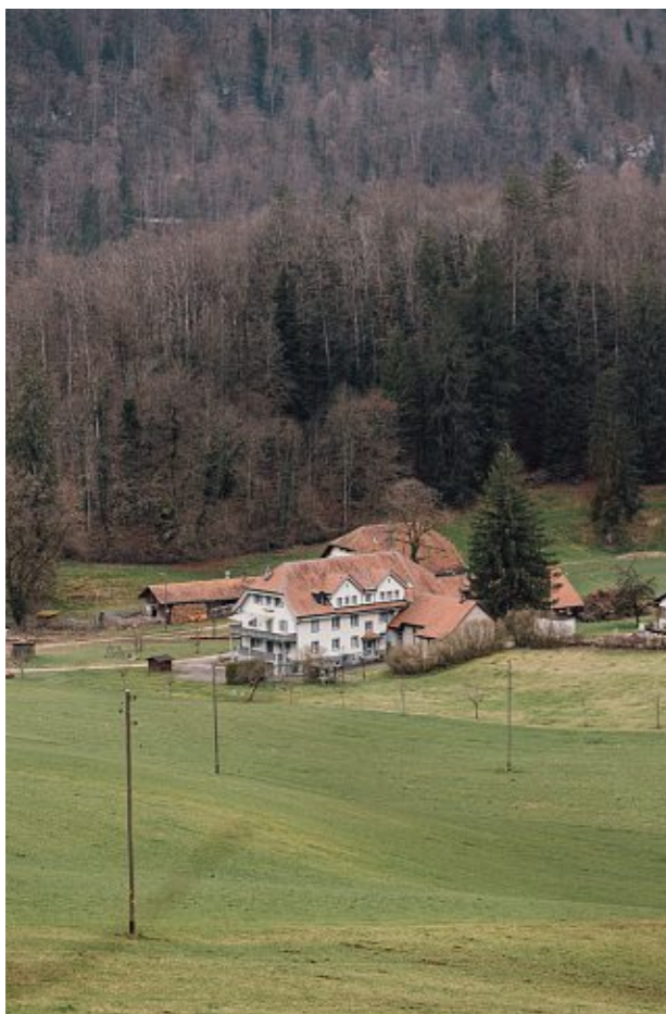
Viele kamen wie Agnes unter Zwang ins Heim, für andere war das abgelegene Belfond Zufluchtsort.